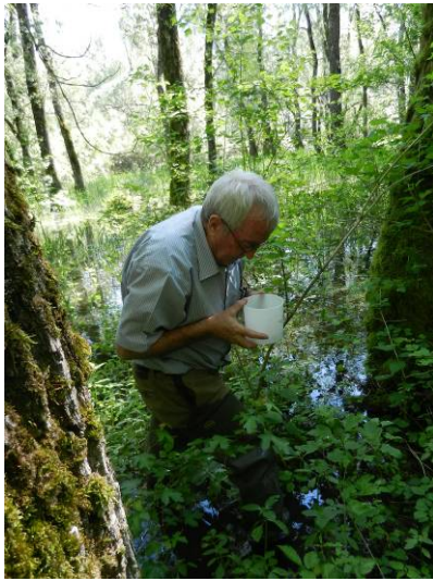
Comptage des larves de moustique