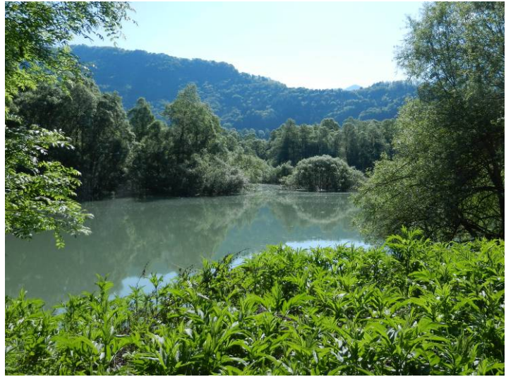
Forêt de saule blanc