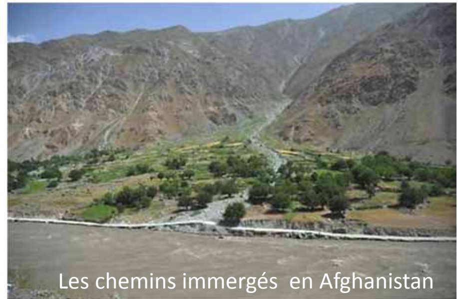
Les chemins immergés en Afghanistan