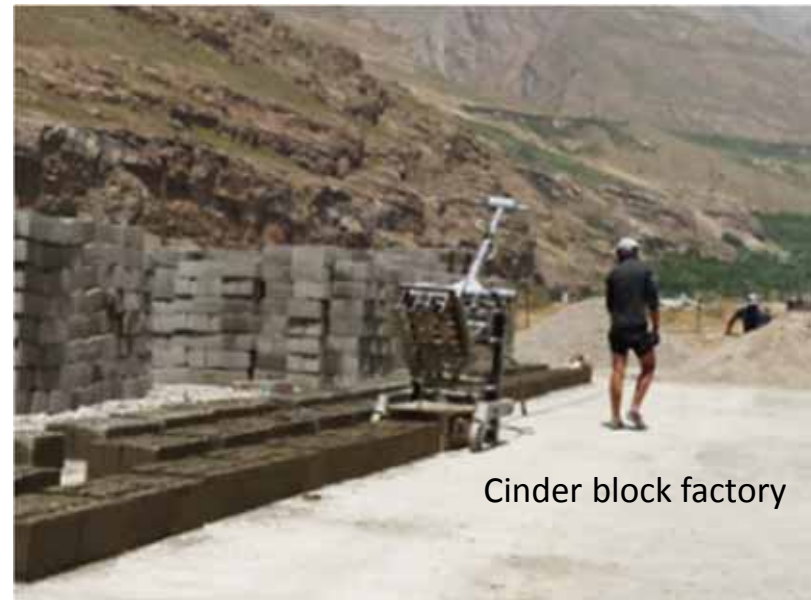
Cinder block factory