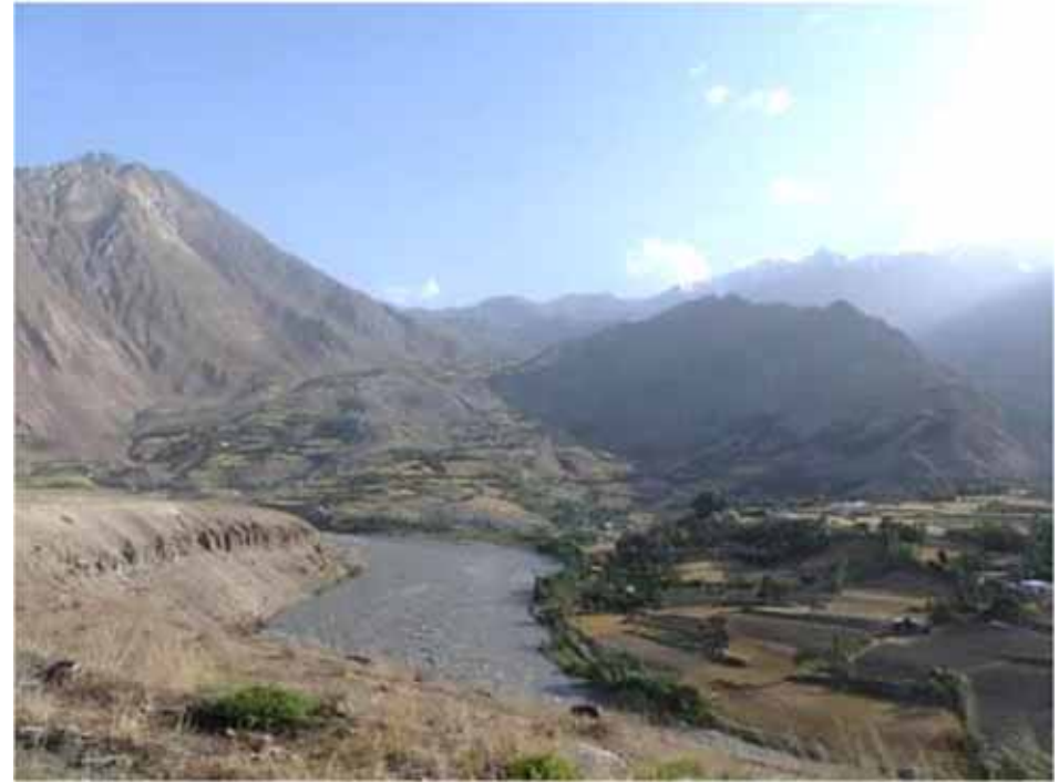
Le Pianjd (921 km, 1000m 3 /s), frontière entre le Tadjikistan et l'Afghanistan