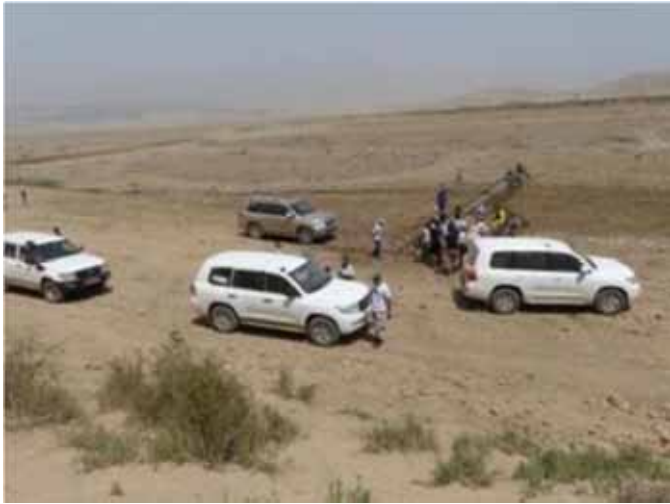
Water for livestock