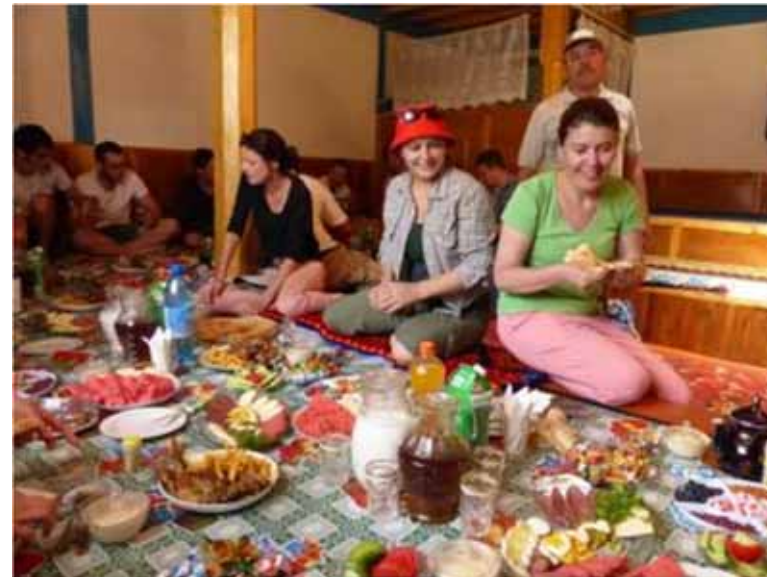
Plov : plat national fait de riz frit avec des carottes et de la viande.