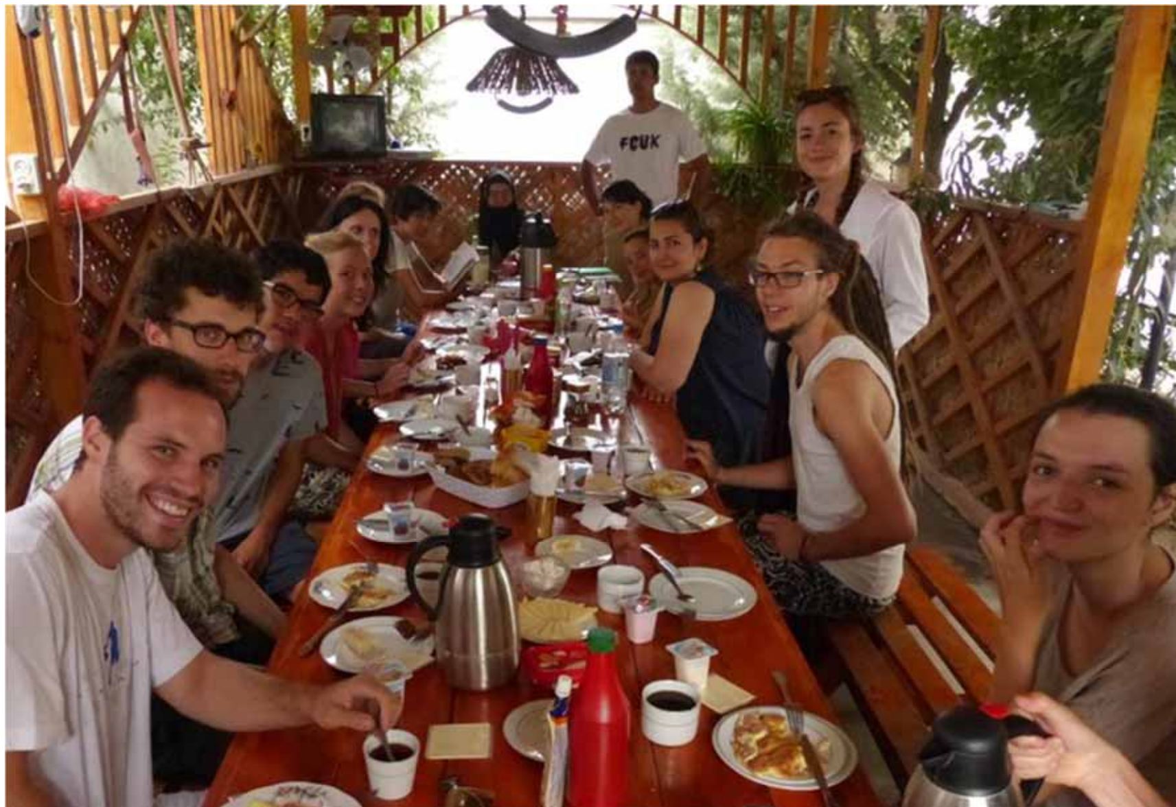
Dernier repas de notre trip