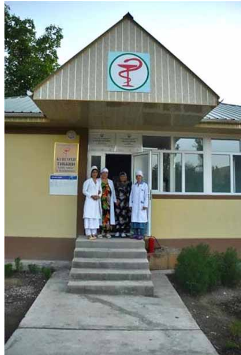
Community Family Medecine (AKHS)