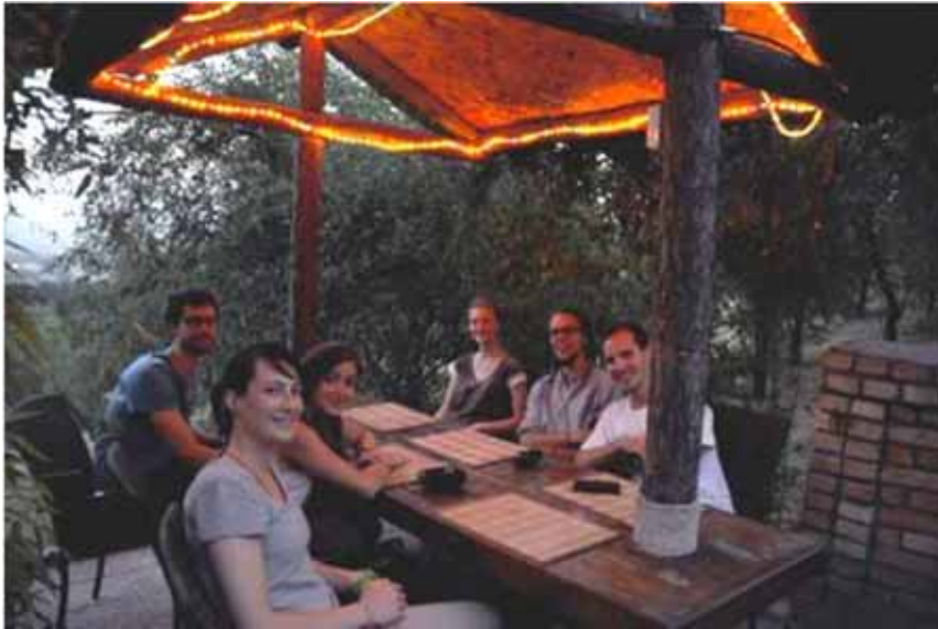
Sim Sim restaurant sur les hauts de Dushanbe