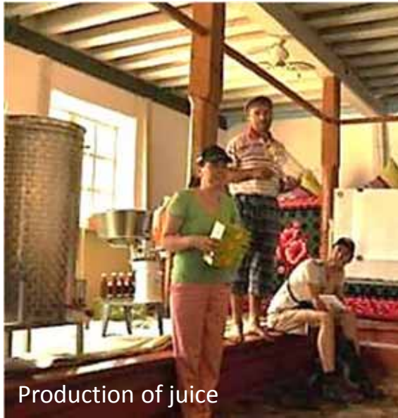
Production of juice

Livelihood development & Income generating; Shikush Village