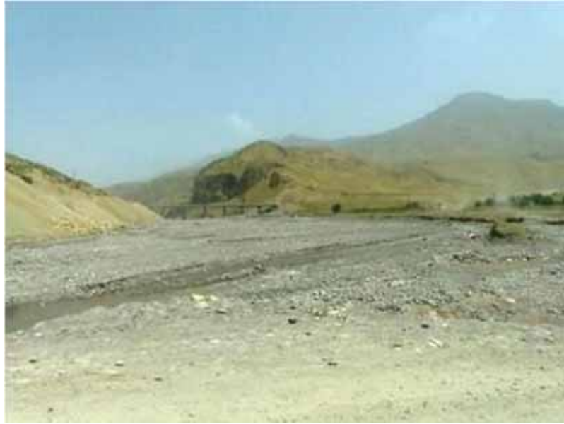
Les nouveaux ponts raccourcissent le trajet