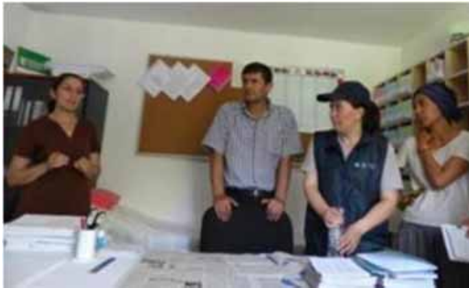
Income Generation / Livelihood Development and Community-based Family Medicine (MSDSP & AKHS)-