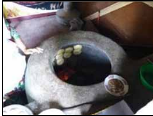
Lipiochka : pain cuit au four Tandoori