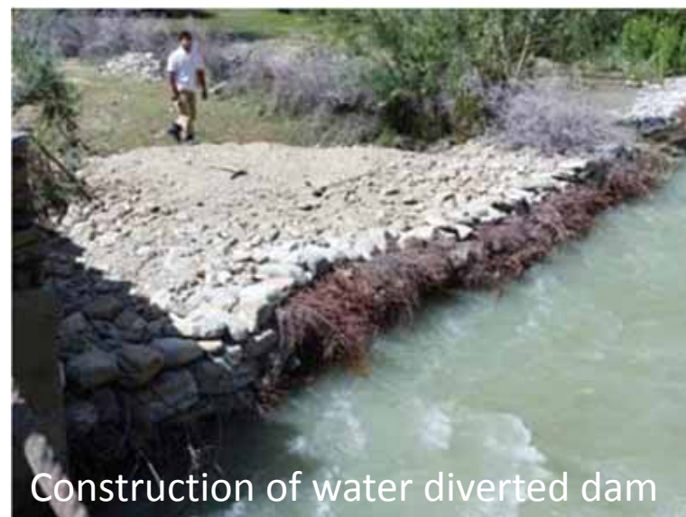
Construction of water diverted dam