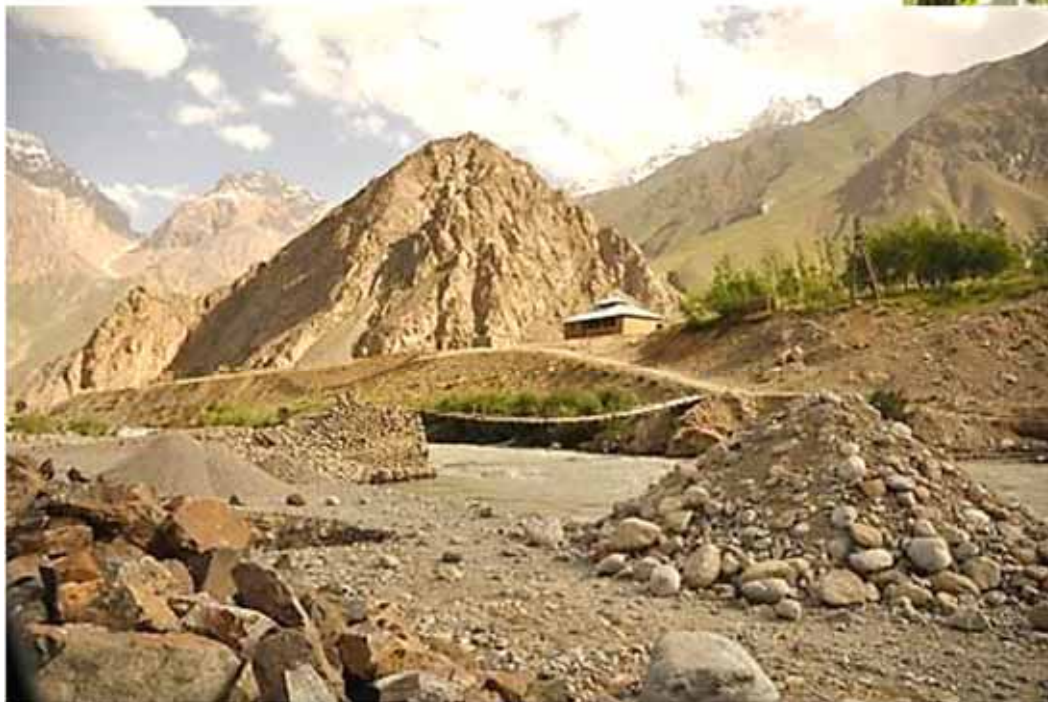
Actual pedestrian bridge