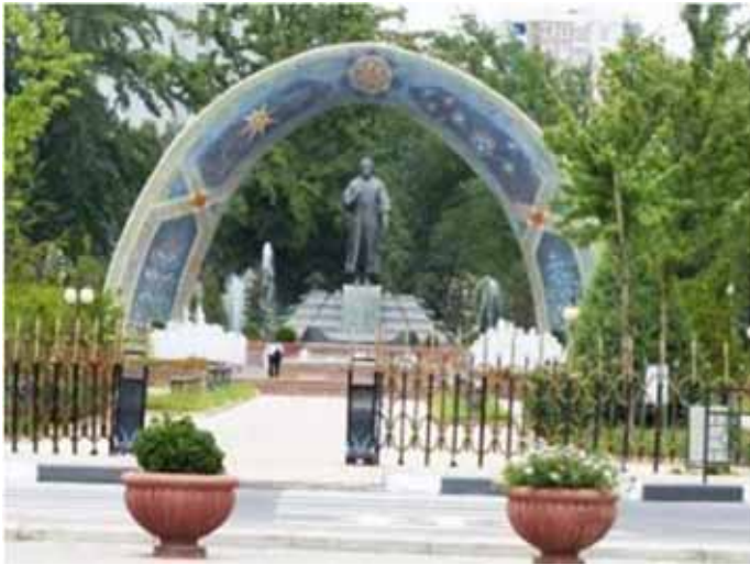
Statue of Somoni