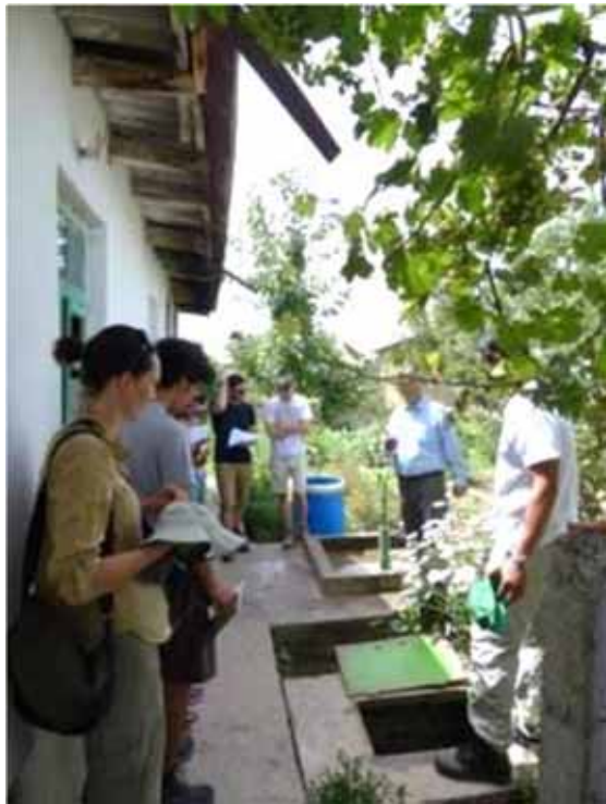
Safe Drinking Water program (Oxfam GB)