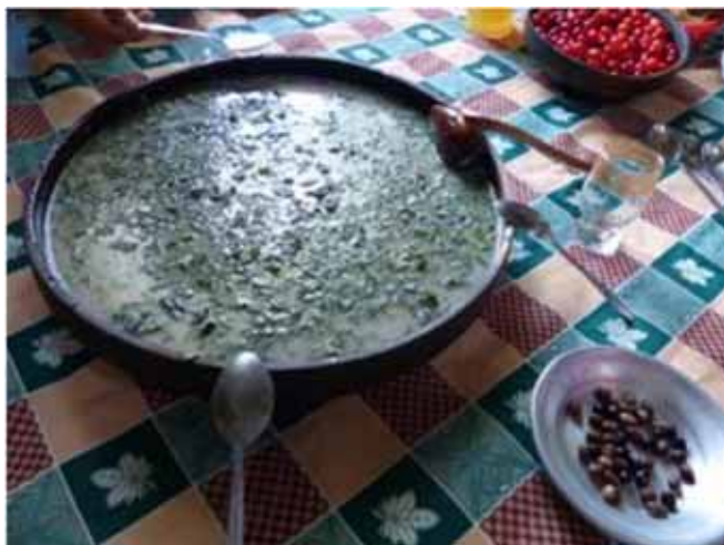
Atola est une soupe claire avec oignons frits dans graisse de mouton + farine et servie avec crème aigre.