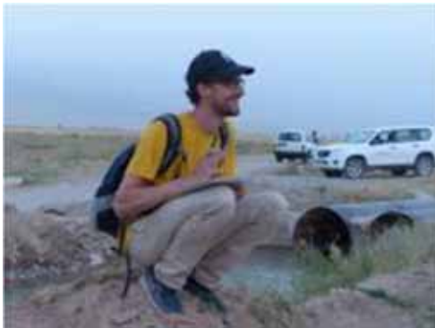
La prise de note