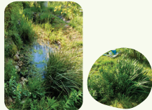
Photos des deux bassins à Moiry, à gauche : bassin 1, à droite : bassin 2