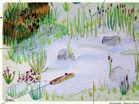
Aquarelle : Manon Bernard