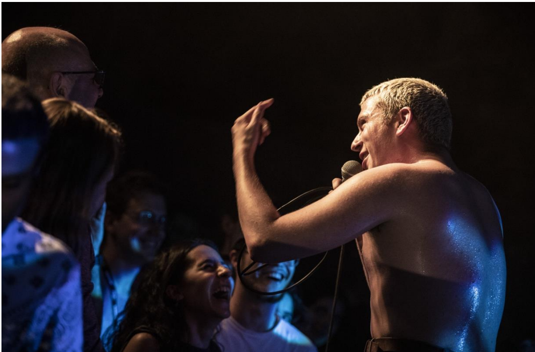
Figure 7 : Photo du concert de Shame dans le Lisztomania le 29.06.2018 18