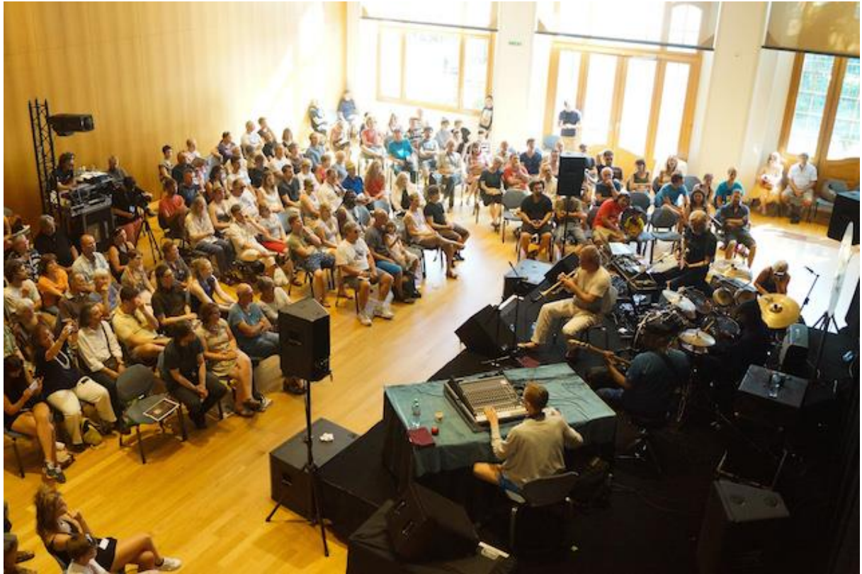
Figure 26 : photo de l'un des workshops du Montreux Jazz Festival 2016 48

La disposition générale décrite précédemment peut être observée dans la photo ci-dessus. Les artistes se trouvent sur scène et sont entourés par le public.