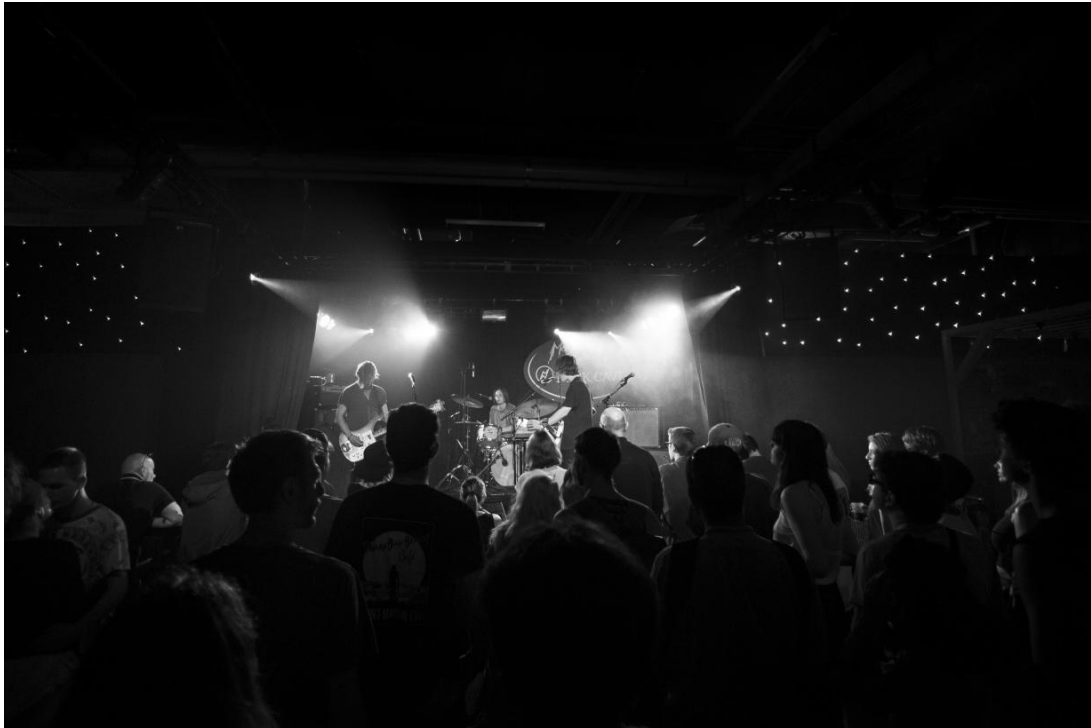
Figure 6 : Photo de la scène et du public dans la Rock Cave en 2016 17