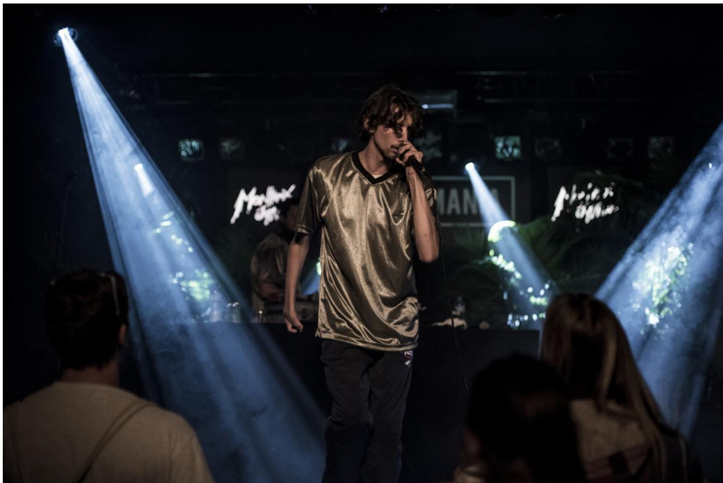
Figure 8 : Photo du concert de Château Ghetto au Lisztomania le 01.07.2017 19

“ Les deux groupes que vous avez cité, ils viennent pour donner un concert pour le plus grand nombre possible de monde, sinon ils ne vont pas parler et discuter avec le public. Aussi je pense qu'un groupe suisse qui joue dans la programmation du festival, ça va lui apporter une plus-value au niveau de la promo. Il va pouvoir dire, “ ok je joue ou j'ai joué au festival ”, ça va lui apporter au niveau de la notoriété. ”