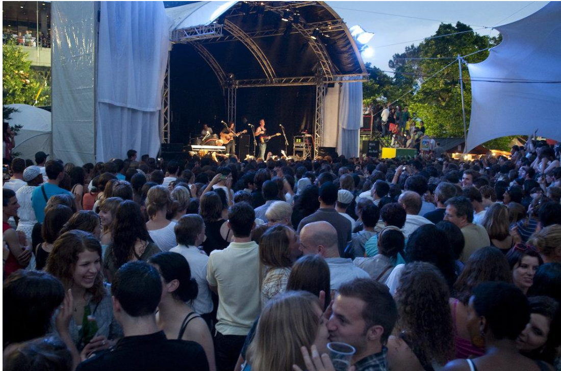
Figure 15 : Photo du public et du chanteur Justin Nozuka à Music in the Park le 03.07.2009 30