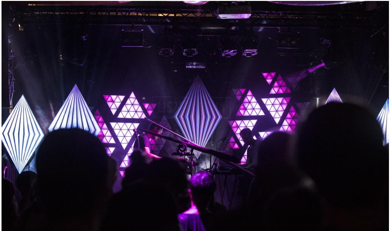
Figure 5 : Photo de la scène du bar Lisztomania 15

On peut remarquer sur la figure 5, photo de la scène du Lisztomania, que l'ambiance est calme et que le public est dans le noir. Cela rend la communication entre le public et les artistes difficile.