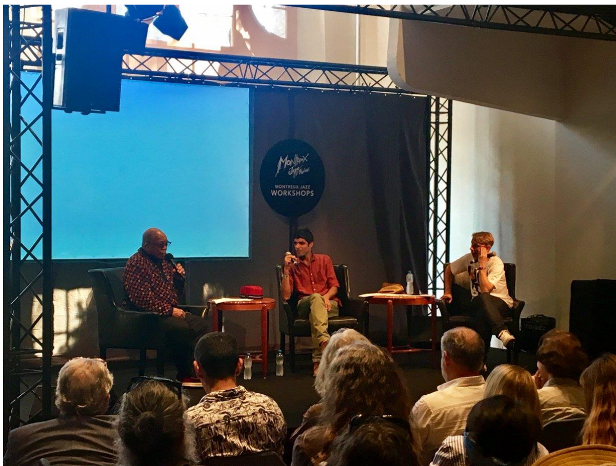
Figure 28 : Photo de Quincy Jones présentant un workshop avec Reza Ackbaraly et Gilles Peterson durant le Montreux Jazz Festival 2017 51

D'un autre côté, les workshops du Montreux Jazz ne se focalisent pas uniquement sur la musique au premier sens du terme, mais explore aussi ses raisons d'être et ses sens cachés. En effet, l'interview faite avec Stéphanie Aloysia Moretti, Rémi Bruggmann et Claudia Regolatti nous apprend que les workshops sont des moments de partage entre musiciens et public, où les artistes ont l'occasion de s'exprimer ouvertement, de parler de ce qui se trouve derrière leur musique. Par exemple, B.B. King a, au cours de ses douze années de participation au workshop, parlé de l'engagement de sa musique dans la défense de la situation des noirs aux Etats-Unis. Natasha Atlas a, de son côté, discuté de la difficulté d'être une chanteuse dans un milieu islamique et des challenges relevé pour pouvoir exprimer son art dans un milieu qui le rejette.