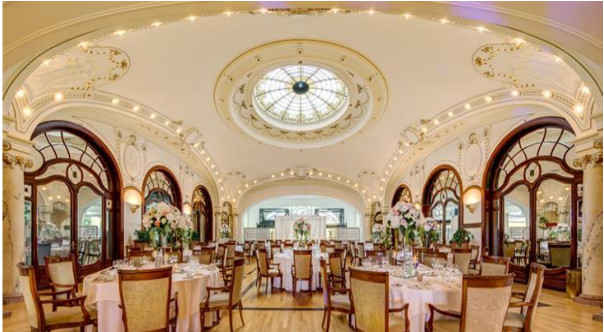
Figure 25 : Photo de La Coupole du Palais dans son décor habituel 47

Les Workshops prennent place dans la Coupole du Palais, au premier étage, qui ne peut accueillir qu'environ 100 à 130 personnes, dépendamment du décor mis en place. La salle porte bien son nom architecturalement, avec son dôme en verre dominant l'espace, et permettant une projection et résonance satisfaisante de la musique, sans mettre en place une sonorisation trop importante. Ceci est dû à la géométrie de la salle, mais aussi aux matériaux utilisés pour la revêtir, notamment au bois recouvrant le sol et une partie des murs.