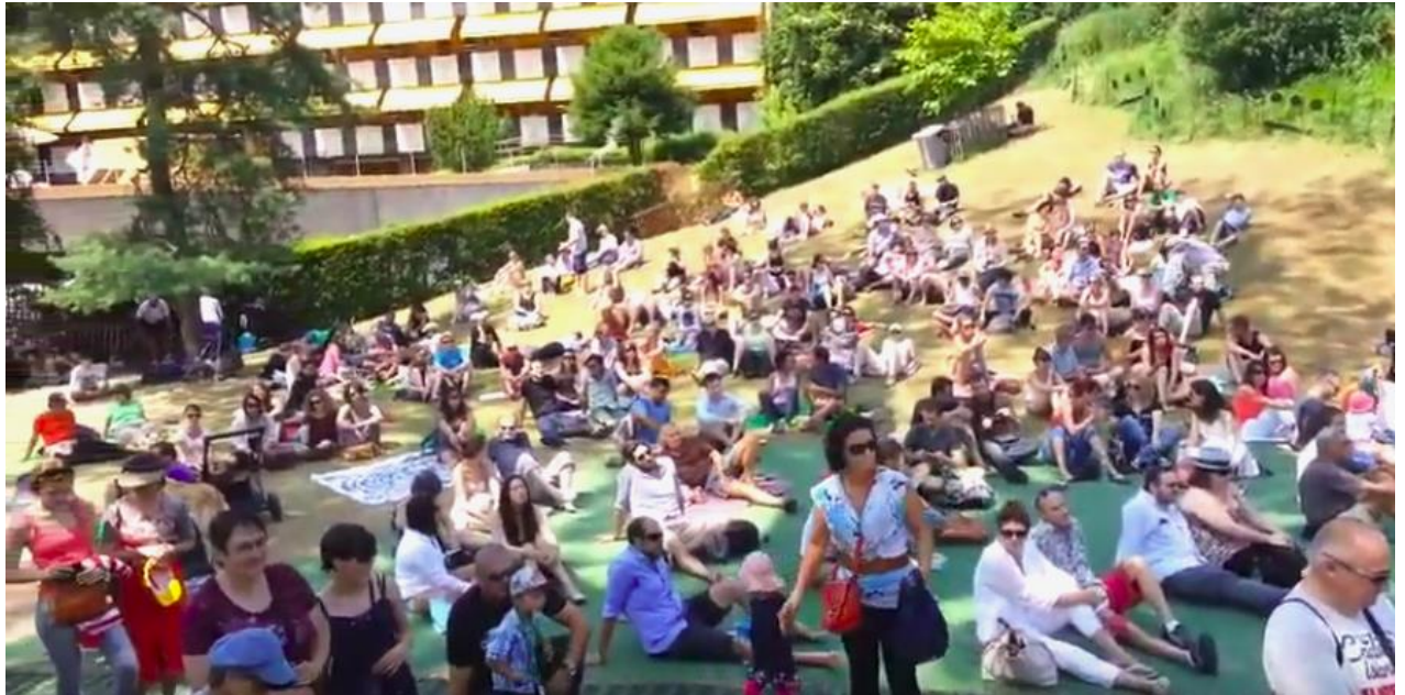
Figure 12 : photo du public de Music in the Park lors d'un concert de Sevda et Alekperzadeh