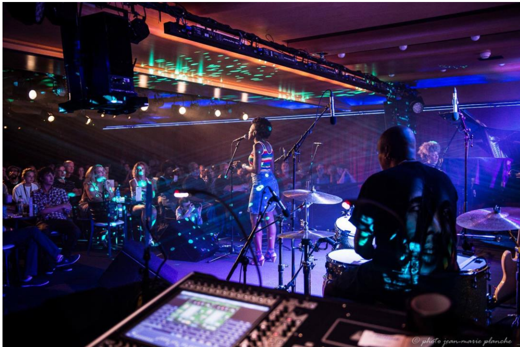
Figure 29 : Le groupe Caramel Brown inaugurant l’une des Jam Sessions du Montreux Jazz Festival 2013 au Montreux Jazz Club 52

Les artistes intègrent ensuite la scène progressivement, et forment un groupe éphémère qui ne jouera ensemble que le temps de quelques morceaux.