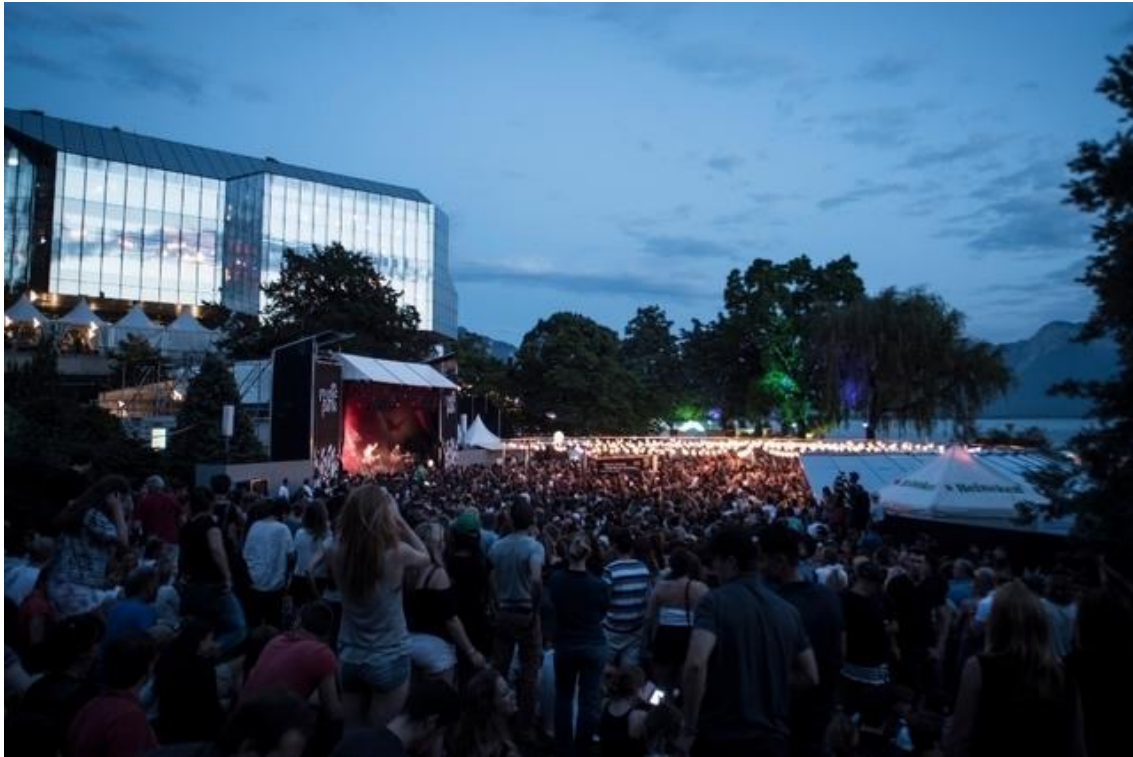
Figure 10 : Photo d'un concert à Music in the Park, 2017 23

Même si la majorité des concerts sont à entrée libre, le volet gratuit du festival a moins de présence sur twitter que la partie payante. Les concerts gratuits n'apparaissent que rarement si on cherche #montreuxjazz.