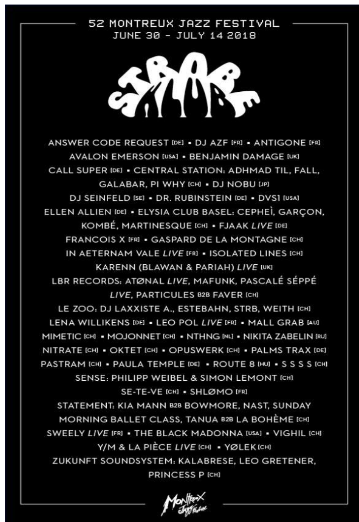
Figure 19 : Programme du Strobe Klub année 2018 37