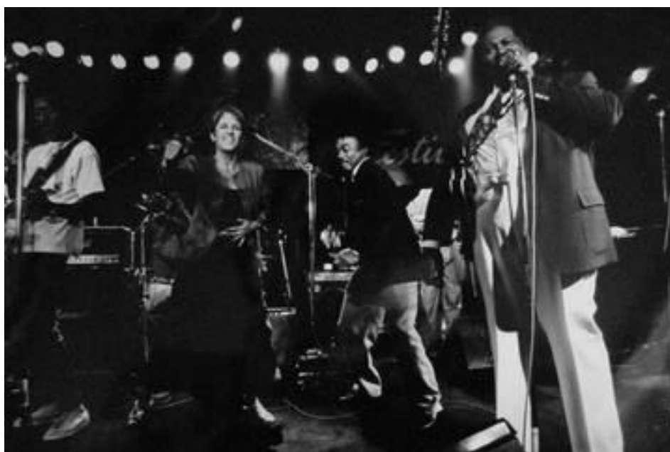
Figure 30 : Photo d'une Jam Session du Montreux Jazz Festival 1989, montrant, de gauche à droite : Luther Allison, Joan Baez, Johnnie Taylor et B.B. King 53

La logistique est aussi applicable aux talents qui participent aux sessions. Les instruments et le nombre de places disponibles sur scène sont limités, ce qui pousse les organisateurs à surveiller attentivement le déroulement afin d'assurer la fluidité de l'événement et de la musique. A ce niveau, plusieurs points sont à noter : il faut premièrement veiller à garder un groupe complet en permanence sur scène, sans avoir de surplus (il n'y a par exemple de place que pour un seul batteur). Ensuite, il est important de maintenir un niveau musical adéquat, ce qui est parfois un challenge, car il est nécessaire que le niveau et l'expérience musicale des différents artistes correspondent afin d'obtenir un bon résultat.