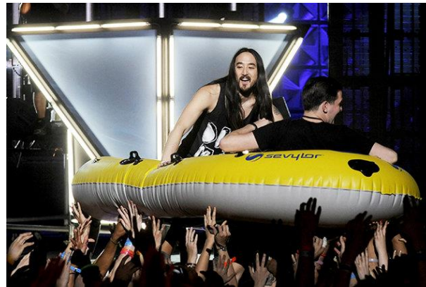
Figure 4 : Photo des DJ Steve Aoki et Dillon Francis dans le cadre des mtv Awards 2012

Laure F. argumente que dans le cas des concerts de rock, le public devient un , et il est véritable acteur de l'événement.