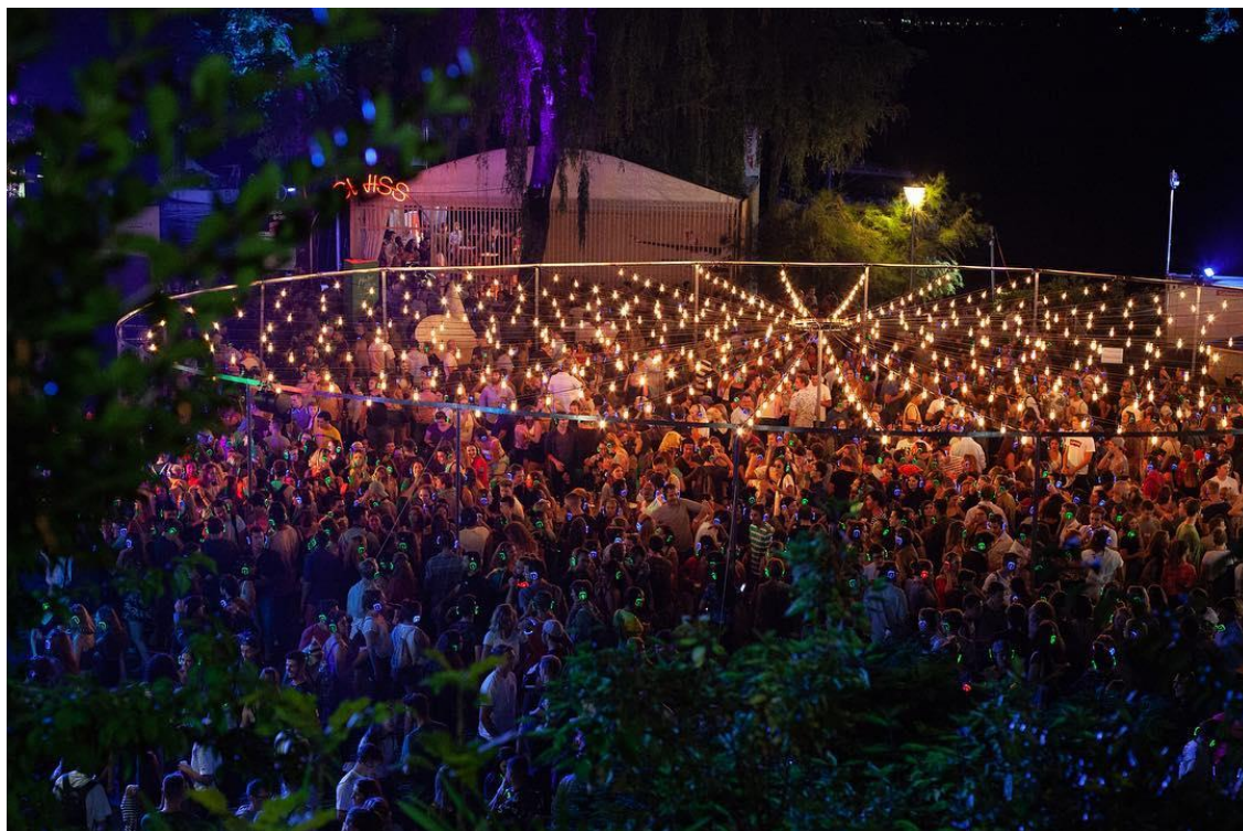
Figure 11 : Photo du public à la Silent Disco de Music in the Park le 13 juillet 2018 24

La photo a à ce jour (Février 2019), 365 likes et aucun commentaire. Le texte de la photo dit :