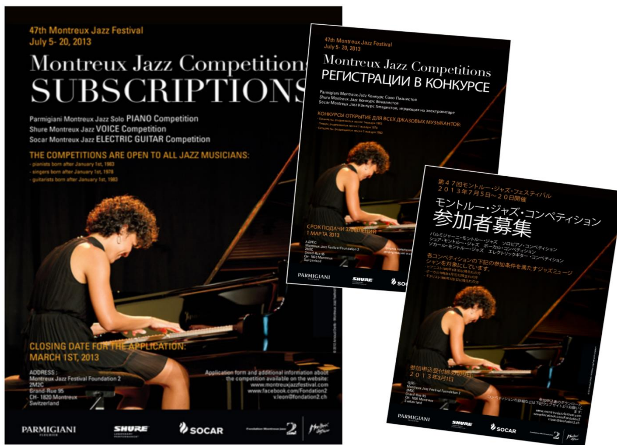
Figure 20 : Affiche 2013 pour la compétition guitare, piano et voix du Montreux Jazz Festival 41

Au tout début du festival, c’est sous la forme d’un concours de Big Band, organisé par les radios européennes, que le festival a pu proposer, à peu de frais, une première compétition pour les jeunes artistes en quête de notoriété. Puis au fur et à mesure que le festival a pris de l’ampleur, ces compétitions ont pu se diversifier.