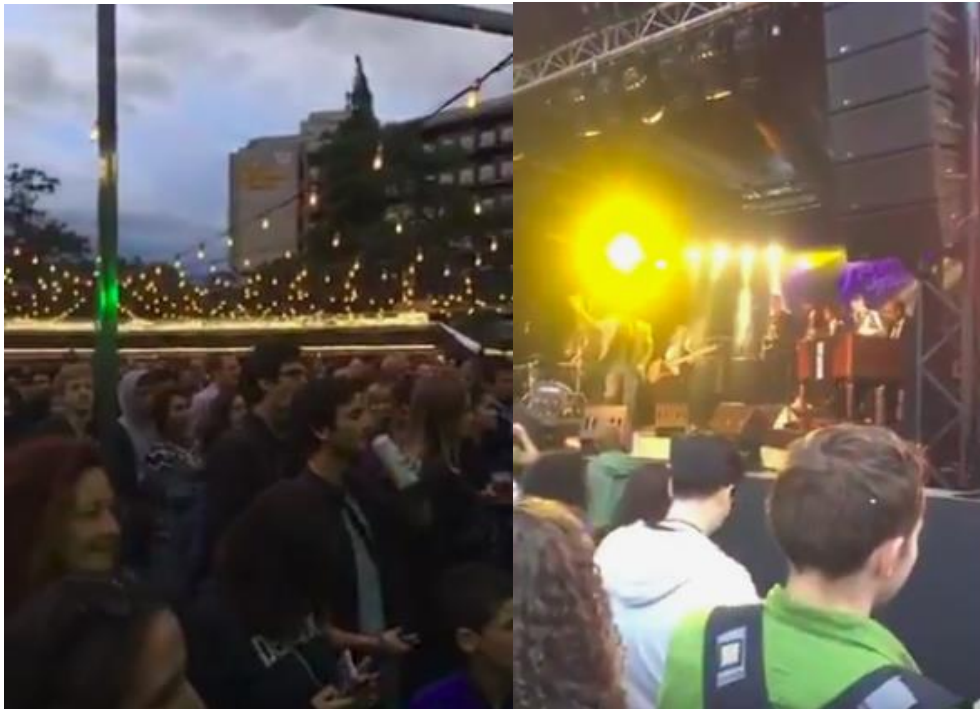
Figure 14 : Photos du concert de Re:Funk en 2017 à Music in the Park

Plus peuplée, la performance du groupe Re:Funk en 2017 28 . Montre un autre type de public. Plus jeune, certains buvant, debout, dansant un peu et criant parfois. L'ambiance est plus festive.