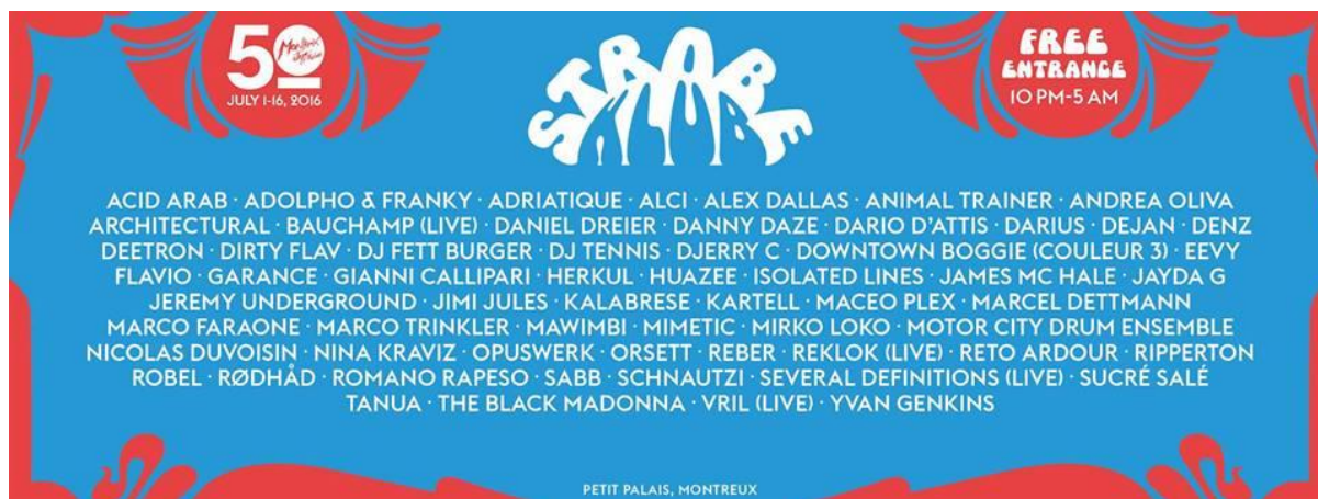
Figure 18 : Le programme du Strobe Club de l'année 2016 36

Avec le MDH Club, est apparu un public qui n'allait pas forcément écouter les autres concerts. Il y allait spécifiquement pour la musique électronique. Mais il y avait aussi de la musique électronique au Stravinsky, dans le festival payant. Il y en avait à tout niveau. Il a notamment eu un concert mythique de Pierre Henry au Miles Davis Hall. C'était un concert électronique dans une salle exclusivement de Jazz où a joué son œuvre " la dixième symphonie de Beethoven ".