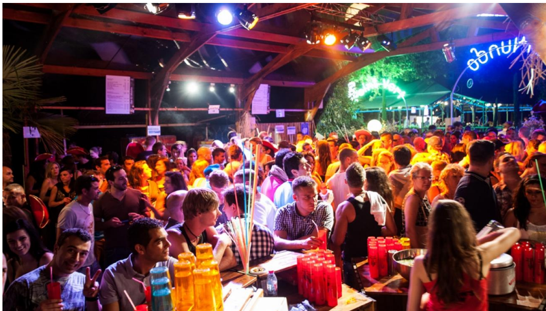
Figure 16 : Photo des festivaliers au bar de la scène El Mundo 31