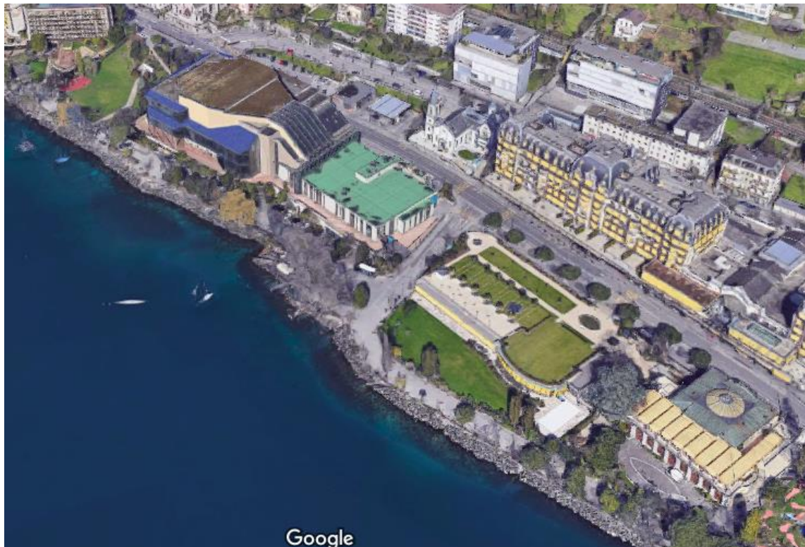
Figure 2 : Modélisation 3D d'une image aérienne du lieu des concerts 2

Il y a même de la musique dans les bateaux et les trains. Il est au bord du lac, ce qui lui confère une ambiance unique. Beaucoup de personnes viennent juste se balader et découvrir la multitude de concerts gratuits.