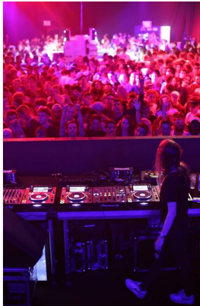
Figure 17 : Photo de l'ambiance au Strobe Klub 32

Avec une capacité de 1200 personnes et une entrée gratuite, le Strobe Klub ouvre de 22h à 5h du matin 33 . Comme on le voit sur la figure 17, photo de l'ambiance, des foules agitées sont typiques des dj set au Strobe. Mais derrière cette image de salle de concert banale se cache une volonté d'originalité.