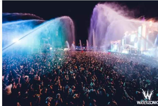
Figure 3 : Photo d'un concert d'électro du festival Waterzonic 6

Tous les éléments cités sont caractéristiques du concert de musique rock d'aujourd'hui, et cela est aussi valable pour d'autres genres, par exemple la musique électronique. Les derniers concerts innovent même au-delà en proposant d'arroser la foule avec de l'eau. Comme on peut le voir sur la figure 3 photo de Waterzonic, un concert d'électro à Bangkok.