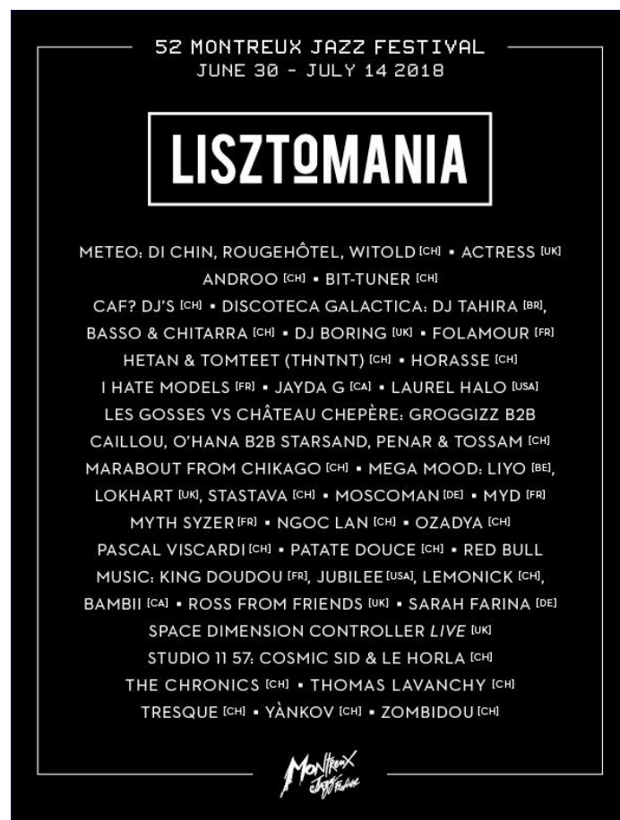
Figure 9 : Programme du Lisztomania en 2018 20

Nous pouvons observer dans le programme du Lisztomania de 2018 sur la figure 9, la variété de nationalités et le nombre d'artistes qui jouent. Ils ne sont pas très connus, par exemple Zombidou a 176 followers sur Soundcloud 21 . Patate Douce en a 121 sur la même plateforme. Sarah Farina d'Allemagne a 9 271 followers, Bambii 4 000, Stastava 337. Ainsi les scènes gratuites du festival off se présentent plus comme un moyen pour les artistes de gagner de la notoriété et pour les festivaliers de découvrir des groupes et passer des moments festifs.