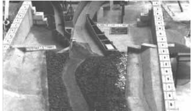
Fig. 2. Maquette de la prise d'eau sur le Flon.

La variante choisie pour l'ouvrage de prise d'eau sur le Flon consiste en un système de convergents imbriqués remarquable par sa simplicité géométrique. La configuration proposée sous-entend par contre un comportement hydraulique complexe qui nécessitait d'être examiné sur modèle réduit (Figure 2).