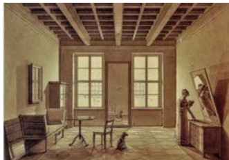
Johann Erdmann Hummel Zimmerbild 1820