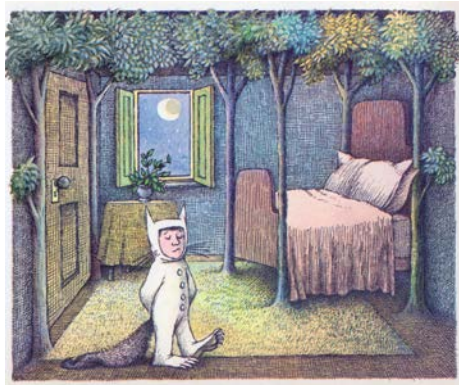
Maurice Sendak Where the Wild Things Are 1963

à la décrire et à la représenter. C'est pourquoi, en parallèle, il sera question d'étudier la relation entre la représentation de l'architecture et son développement conceptuel.