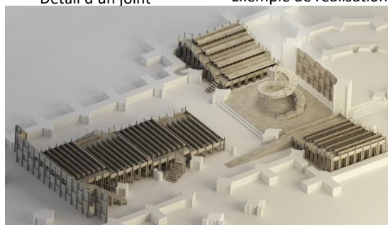
Maquette de l'installation dans la Cathédrale