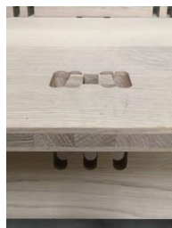
Détail d'un joint