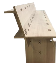
Prototype de banc