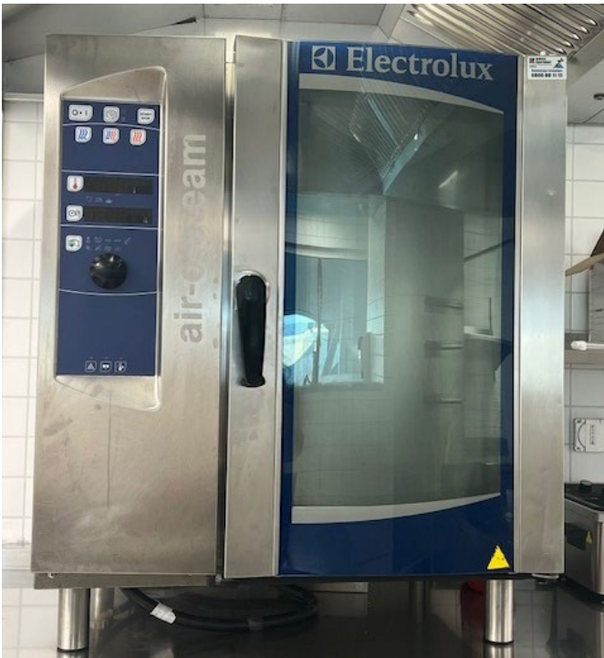
Four à 10 niveaux