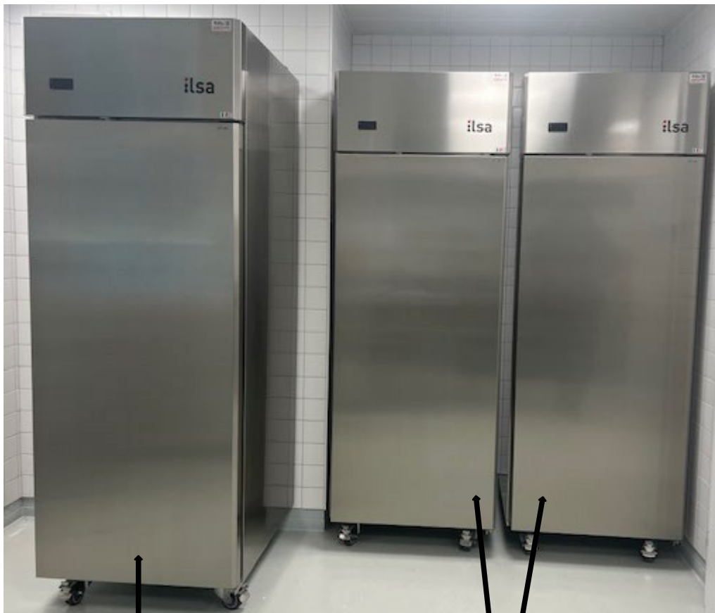
Armoire négative (congélateur)