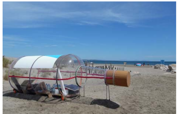
Bouteille, Plage Napoléon (Port-St-Louis-du-Rhône) 2015