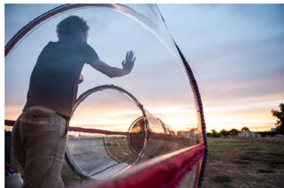
Bouteille, Parc de la Révolution (Port-Saint-Louis-du-Rhône), 2015