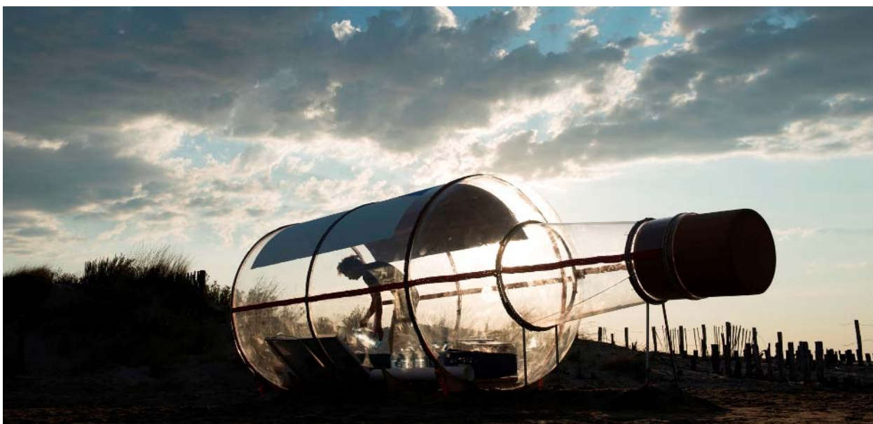
La Bouteille, plage Napoléon à Port-St-Louis du Rhône

Un projet d' Abraham Poincheval avec le Citron Jaune, centre national des arts de la rue