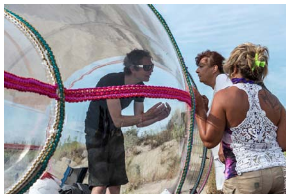
La Bouteille, plage Napoléon à Port-St-Louis

Pour discuter avec Abraham, lui offrir un gâteau ou partager un verre (mais ce n'est pas sûr qu'il accepte), on passe en rentrant du centre aéré ou en allant au marché, on s'arrête pour regarder passer les bateaux, on s'approche la nuit sur la pointe des pieds pour vérifier qu'il dort bien là... On va à la Bouteille parce que c'est quand même extraordinaire cet homme qui vit au grand jour (même la nuit) et totalement disponible à ce qui se passe.