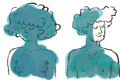
Eve et Adam