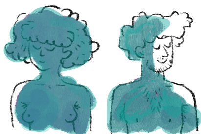
Eve et Adam

L'ÉTUDIANTE ET LES ÉTUDIANTS LES ÉTUDIANTES ET L'ÉTUDIANT L'ÉTUDIANTE ET L'ÉTUDIANT LES ÉTUDIANTES ET LES ÉTUDIANTS